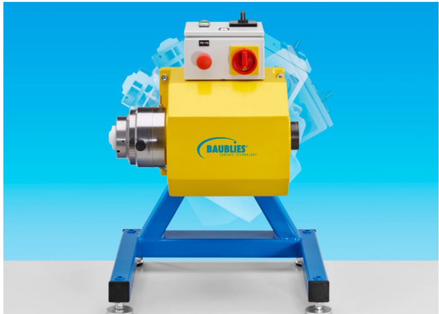
Leichte Verstellmöglichkeit der Neigung in 30°-Schritten

Besonders komfortabel sind die stufenlose Einstellung des Soll-Durchmessers sowie die leichte Verstellmöglichkeit der Neigung in 30°-Schritten. Dadurch ist die ergonomisch optimale Bedienung der Maschine sicher gestellt.