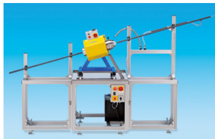
Das als Sonderzubehör erhältliche Untergestell ermöglicht ein ergonomisches Arbeiten.