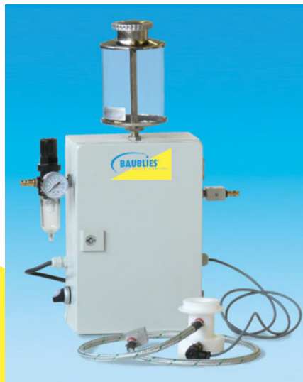
Auf Wunsch kann die Maschine mit einer Minimalmengenschmierung ausgestattet werden.